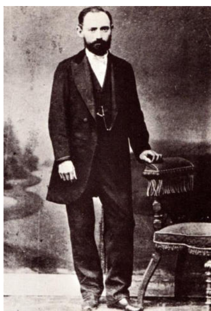
Angster József 1880 körül

Angster József Kácsfalun (ma Jagodnjak, Horvátország) született egy katolikus német bevándorló család sarjaként. Már hatéves korától befogták a falusi munkába, 16 éves volt, amikor asztalosinasnak adták, három évvel később egy kisebb vándorút, 1856–1866 között a nagy vándorút következett. Megfordult Bácskában, Bécsben, Drezdában, Lipcsében, Kölnben, Párizsban. 1867-ben önálló műhelyt alapított Pécsen, az ezt követő nyolc évtizedben család öt férfi tagja – főként Angster József és fia – 1300 orgonát és 3600 harmóniumot készített.